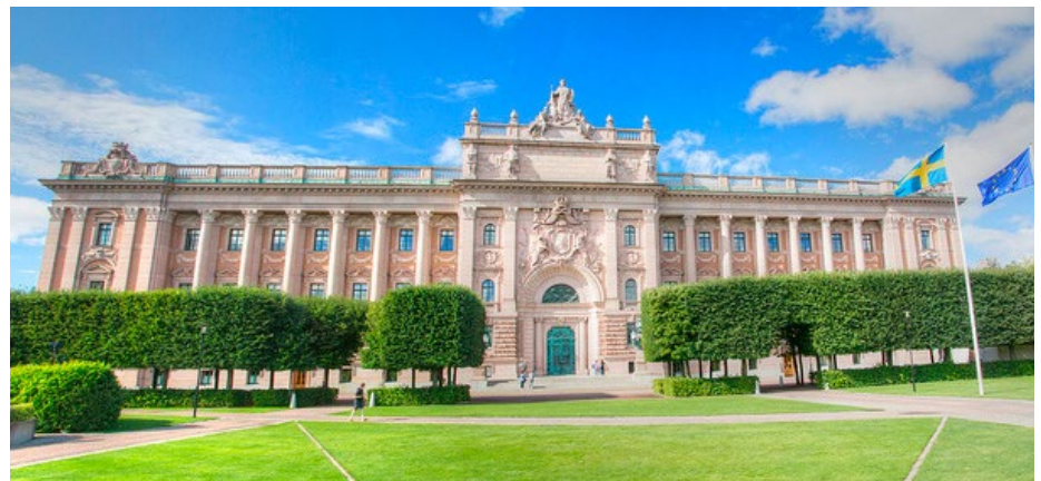
budova Parlamentu (Riksdagshuset), použité foto: flickr.com

Obdobné semináře ERT se konají průběžně v různých zemích EU, zájemci proto mohou sledovat sekci Aktuality na webových stránkách Institutu.