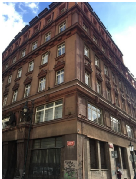
Původní sídlo Institutu v pražské ulici Na Perštýně